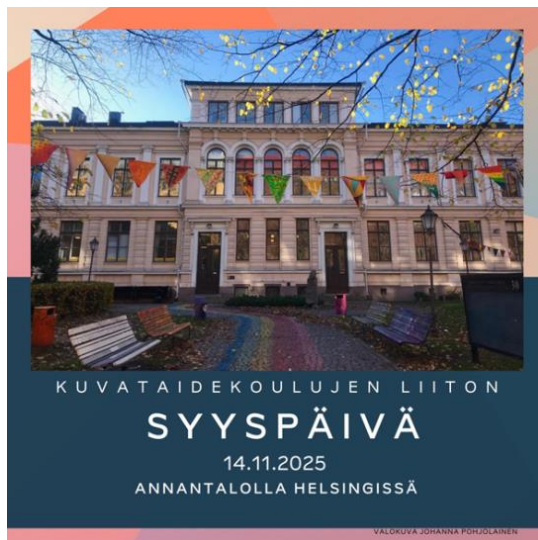
Kuva: Johanna Pohjolainen. Taitto: Eliisa Sorvali.

Paikat: Galerie Forsblom , Lönnrotinkatu 5, Suomitalon sisäänkäynnin kautta , Helsinki Contemporary , Bulevardi 10 ja Annantalo , Annankatu 30, Helsinki.