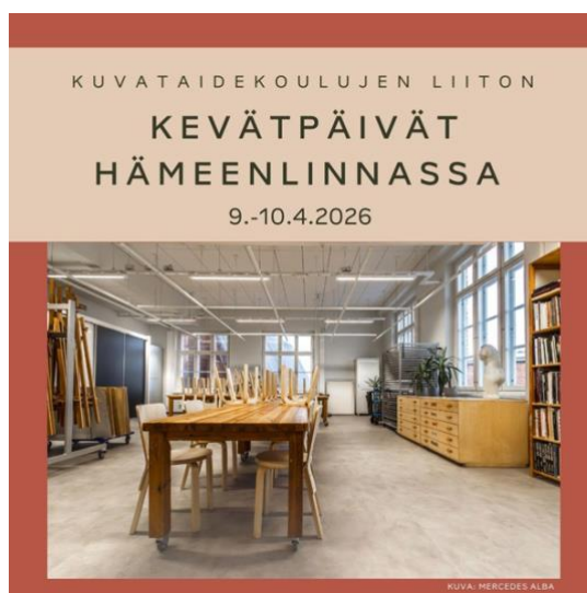
Taitto: Eliisa Sorvali.

Paikat: Hämeenlinnan Raatihuone, Raatihuoneenkatu 15, 13100 Hämeenlinna ja Aimokoulu / Verkatehdas, Paasikiventie 2, 13200 Hämeenlinna.